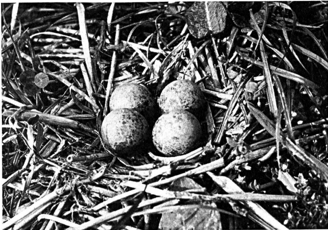
Gelege des Kiebitz

Es wäre wirklich schade, wenn dieser interessante und attraktive Vogel für immer aus unsern Feldern verschwinden würde.