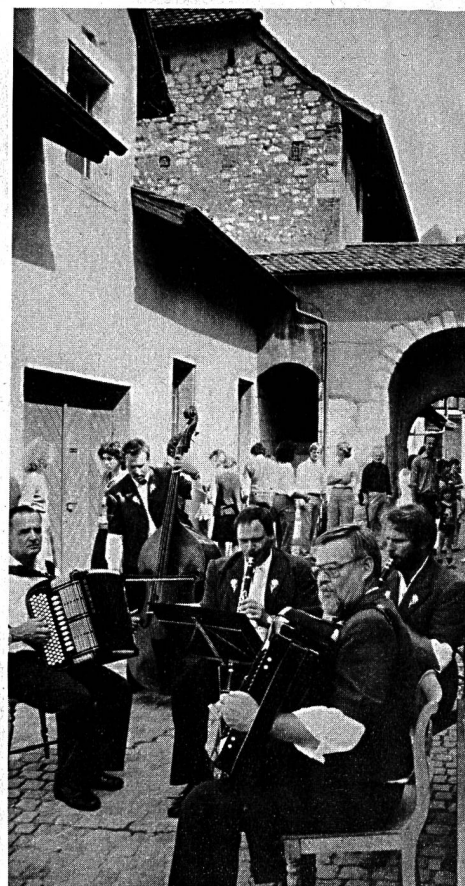
Festungsbesichtigung anlässlich des 25-Jahre-Jubiläums des Schlüssels im September 1982