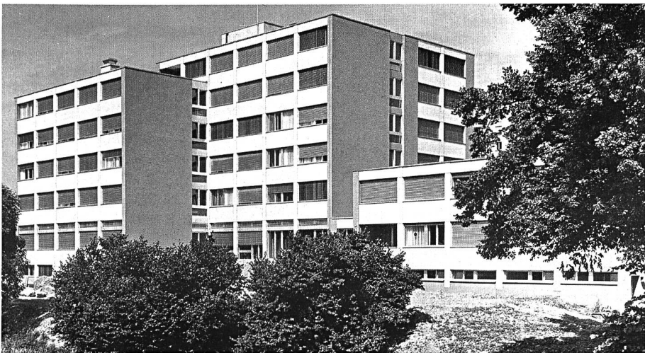
Die Ansicht von Westen her.

Am 26. Juni 1970 fand der erste Spatenstich statt, und am 20. April 1971 folgte das Aufrichtefest. Aber noch dauerte es mehr als ein Jahr, bis die Arbeiten abgeschlossen werden