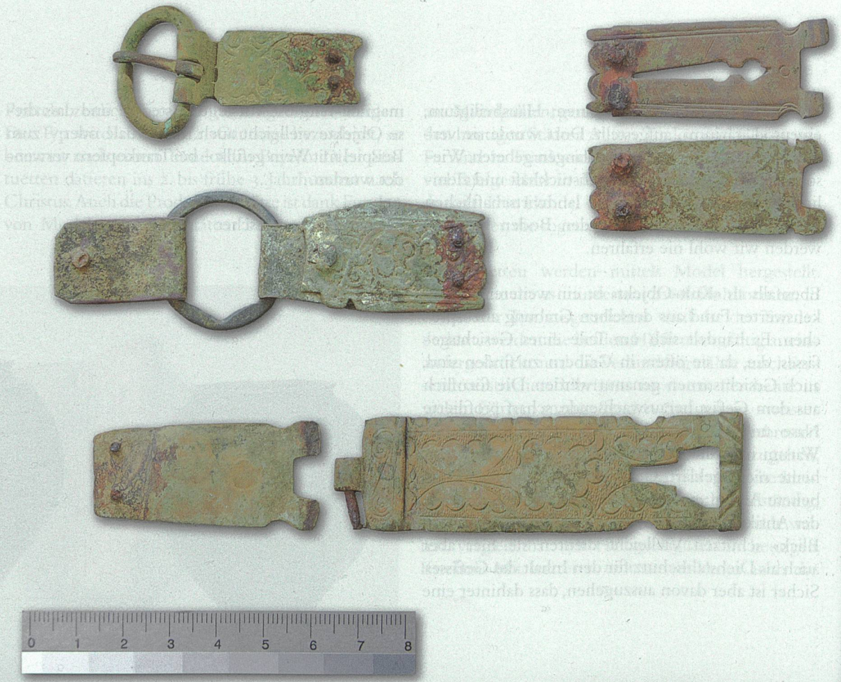
Grellingen, Schmälzeried. Beschlüge von einem neuzeitlichen Frauenschmuckgürtel.