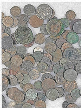
Über 14 000 antike Münzen stellten die Behörden in diesem Fall sicher.