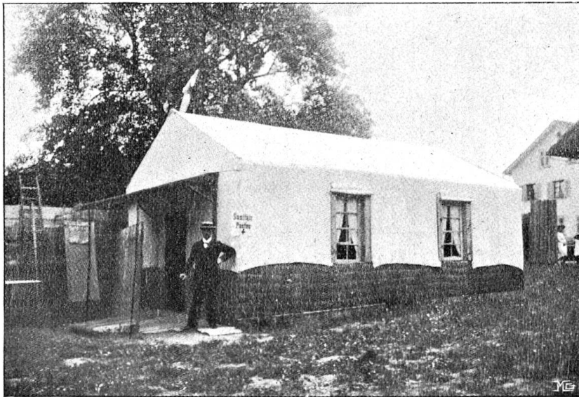
Sanitätshütte des Samaritervereins Wiedikon (Aeußerer).

mit unsern gemeinnützigen Achseln unterstehen, den Bau der Hütte auf uns nehmen und durch unsere Samariterinnen und Samariter ausführen würden?“ Die Frage stellen, hieß sie mit einem kräftigen „Ja“ beantworten, wenn man in Betracht zog, daß auch andere Quartiervereine der edlen Sache Opfer an Zeit und Kraft brachten, und da noch der weitere Umstand hinzukam, daß mit einem