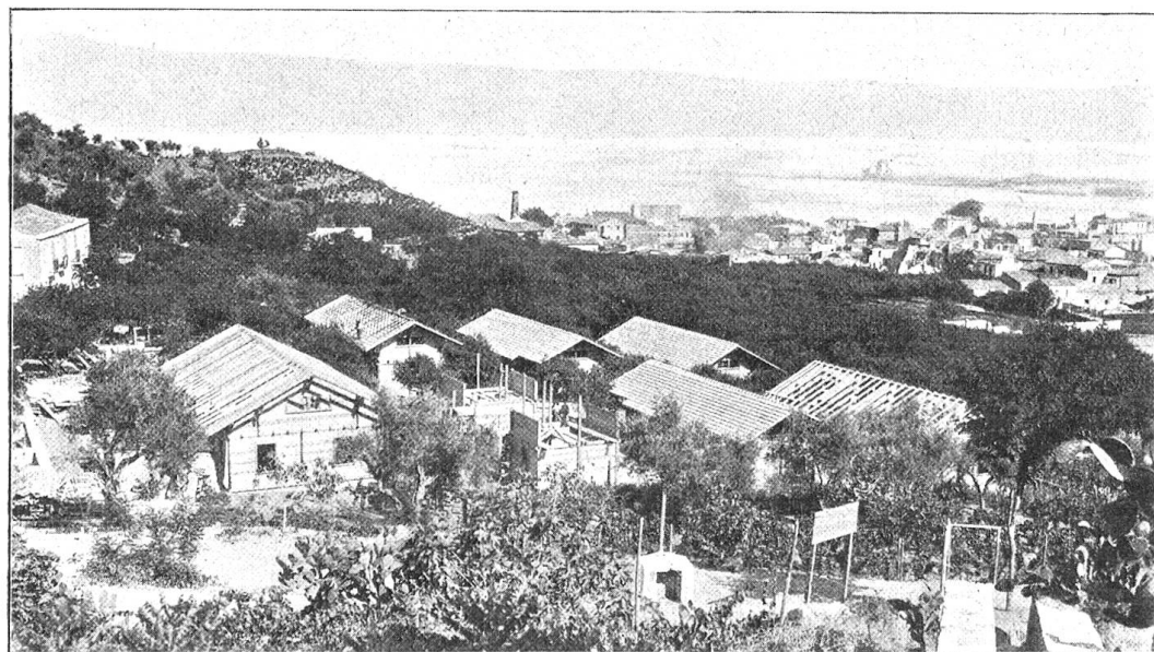
Messina, Schweizerdorf im Bau.