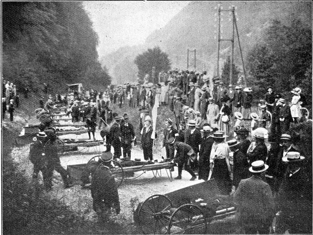
Vom bernischen Rot-Kreuz-Tag in Tavannes. — Die Sanitätshülfskolonne Biel mit den Räderbahren.

15 an der Zahl. 10 sitzend zu Transportierende fanden willkommene Unterkunft im nunmehr leer gewordenen Kolonnenfourgon. Ein hübsches Bild bot alsdann die Karawane, wie sie sich um 10 \frac{1}{2} Uhr die Straßenwindungen emporschlängelte (siehe Bild), voran das Auto des Generalstabschefen Dr. Geering, dann der „Leichenzug“ der braunen Sargbahren, beziehungsweise der 10 mit braunem