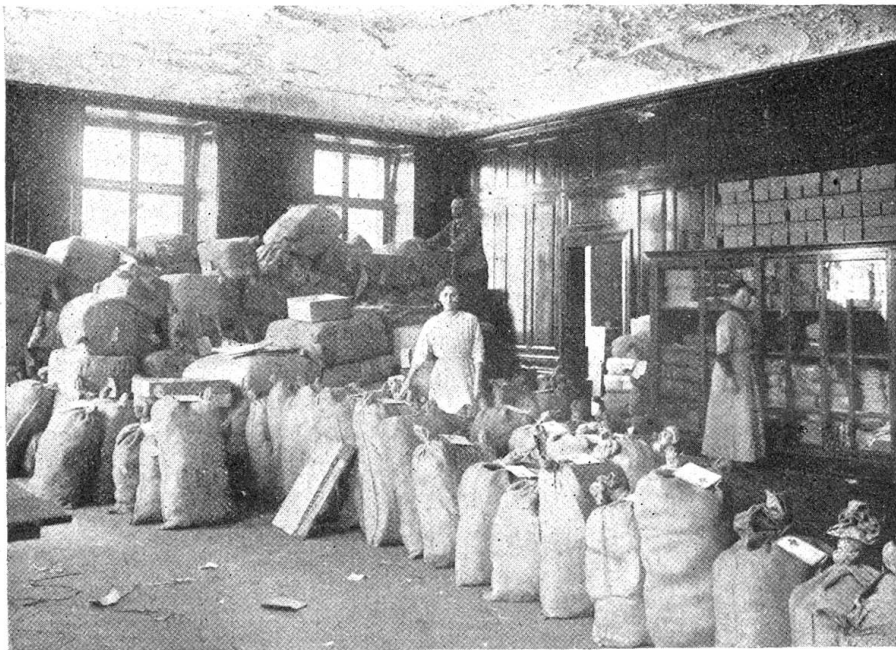
Aus unſerm Zentraldepot. — Die tägliche Spedition iſt verlanbbereit.

Seit Oktober 1914 bis 31. Oktober 1915 hat das Depot Zürich folgende Sendungen ausgeführt: