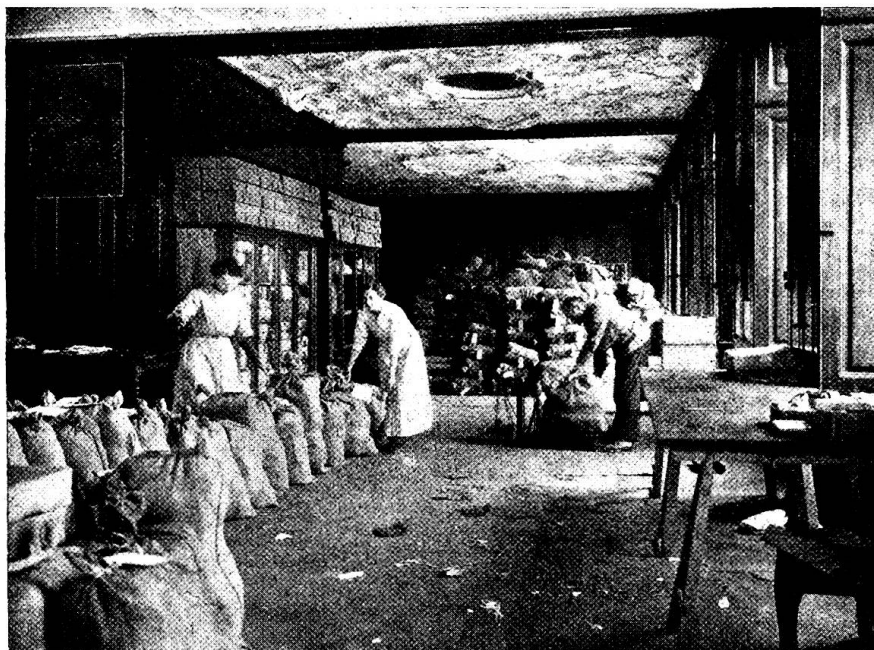
Aus unserm Zentraldepot. — Beim Packen und Vernähen der Postfäcke.

Im verfloffenen Oktobermonat hat das Depot allein 3941 Hemden an die Truppen versandt.