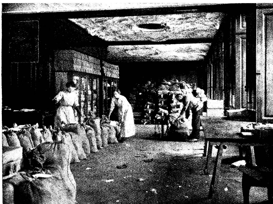
Aus unserm Zentraldepot. — Beim Packen und Vernähen der Postfäcke.

Im verfloffenen Oktobermonat hat das Depot allein 3941 Hemden an die Truppen versandt.