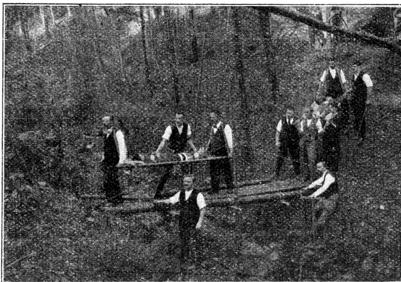
Feldübung Neumünster: Notfeg über den Bach