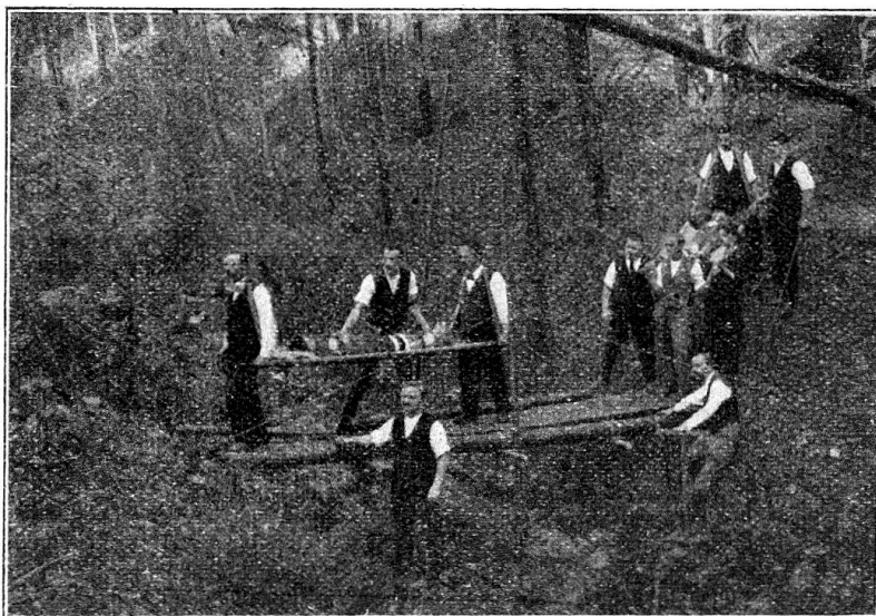
Feldübung Neumünster: Notifeg über den Bach