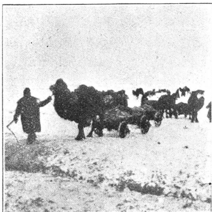
Auswanderung der Hungernden Wegen Futtermangel gehen die Pferde zugrunde, es mußten deshalb Kamele verwendet werden

mente und Verbandzeug und vor allem aus Desinfektionsmaterial, sowie die notwendigen Spitalgerätschaften. Von der Uebernahme eines