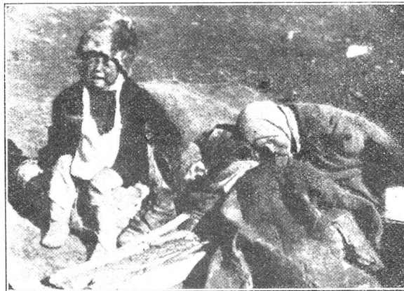
Sterbende Mutter mit ihrem hungrigen Kind