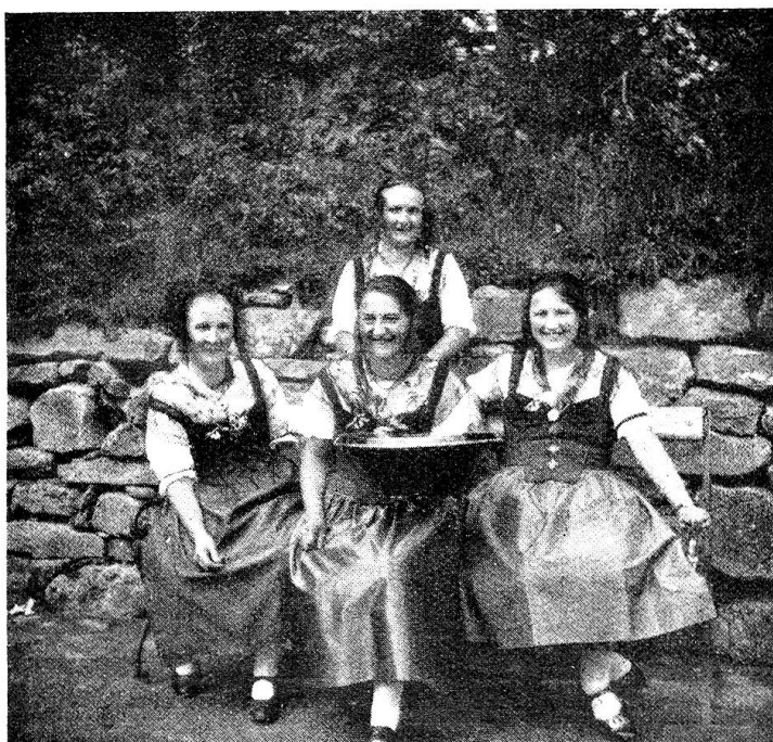
Unsere lieben Sänginnen.

In den Saal der „Linde“, der fast zu klein war, um all die Gäste zu fassen, hatte das Organisationskomitee die Gäste eingeladen, um einer äußerst gediegenen Abendunterhaltung beizuwohnen. Urwüchsiges aus