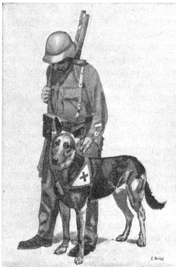
Bundesfeierkarte 1937 - Carte du 1er août 1937

Kinder im Sande spielend Enfants jouant à la plage