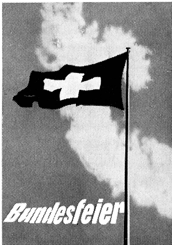
Die Bundesfeierfahne Le drapeau du 1 er août 1937