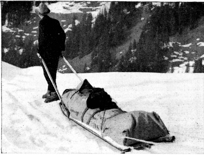
Rettungsschlitten Typ «Luzerner Kanadier» (Konstrukteur C. A. Birrer, Rettungsobmann, Luzern). Ein Verunfallter mit Oberschenkelbruch wird abtransportiert.

Die im Alpengebiet verstreuten Meldestellen versehen den Melde- oder Signaldienst. Sobald irgendwo in den Bergen ein Notsignal vernommen wird, beginnt der Apparat zu funktionieren: Von Unfallstelle zur Hütte, die mit Rettungsmaterial ausgerüstet ist und deren Besatzung die erste Hilfe bringt; dann weiter zur Hauptstation, die in schweren Fällen sofort mit Automobil und Seilbahn so hoch hinauf als möglich verlegt werden kann. Verschiedene Hüttentelephone unterstützen ein rasches Handeln, denn im Rettungsdienst gilt als oberster Grundsatz: Schnellste Hilfe ist beste Hilfe.