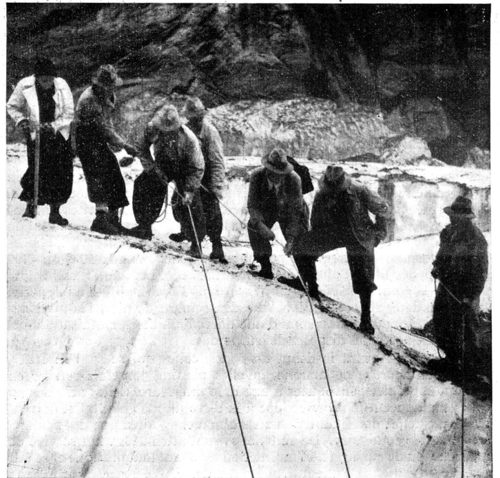
Bergung aus einer Gletscherspalte.

Vermisste Alleingänger sind für den Rettungsdienst stets Probleme. Wir suchten einen jungen Familienvater in einem grösseren Bergmassiv der Innerschweiz. Zwei Suchpartien kehrten nach zwei Tagen erfolglos zurück; sie hatten nur Ski und Rucksack gefunden. Flugzeuge überflogen ohne Erfolg das ganze Gebiet. Im Rucksack fanden wir einen neuen Tourenführer, der sich immer auf der gleichen Seite öffnete. Ein Fingerzeig! In zwei Gruppen wurde der Berg abgesucht, der auf der aufgeschlagenen Seite beschrieben war. Ein paar Meter unter dem Gipfel sichteten wir den eingeschlagenen Bickel, einen Hut und eine Schneibrille. Der Gesuchte musste über die 300 Meter hohe Nordwand