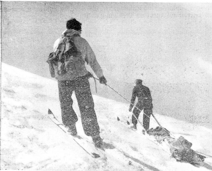
Fahrt am Steilhang mit dem «Luzerner Kanadier». Der Verunfallte ist durch ganz geschlossene Segelblachen vollständig geschützt.

Ein anderes Mal suchten wir an einer noch unbestiegenen Nordflanke nach einem lieben Bergkameraden, der in Stunden tiefster Depression seinem Leben in den Bergen ein Ende bereitet hatte. Auch der fünfte schwierige Durchstieg der Wand war erfolglos geblieben. Die abgekämpfte Mannschaft, teilweise von Steinschlag verletzt, zog ent-