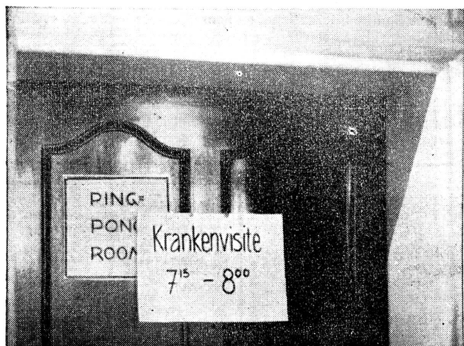
Aus einer Militärsanitätsanstalt. Aus dem Ping-Pong Room ist ein Krankensaal geworden. Schlagfertige Reden fliegen wie Bälle von Lager zu Lager; der kameradschaftliche Soldatenton herrscht auch bei den Kranken und überdeckt mit heiterer Resignation Schmerzen und trübe Nachrichten.

Bei den Wundinfektionen mit Anaerobiern gilt zwar immer noch der Satz, dass die sachgemässe primäre Wundversorgung im ersten Rang steht, und dass die spezifische Serumprophylaxe nur eine unterstützende Massnahme ist. Die Erfahrungen der letzten Weltkriegsjahre lehren nun aber auch hier, dass durch eine frühzeitige und ausgiebige prophylaktische und therapeutische Applikation hochwertiger Anaerobensera die Letalität dieser Wundinfektionen ganz bedeutend herabgesetzt werden kann, und viele sonst notwendig werdende Amputationen überflüssig macht. Die Bereitstellung grösserer Mengen hochwertiger polyvalenter Anaerobensera für die Armee ist sicher demnach angezeigt. Es ist nun aber nicht zu verkennen, dass dieser Serum-