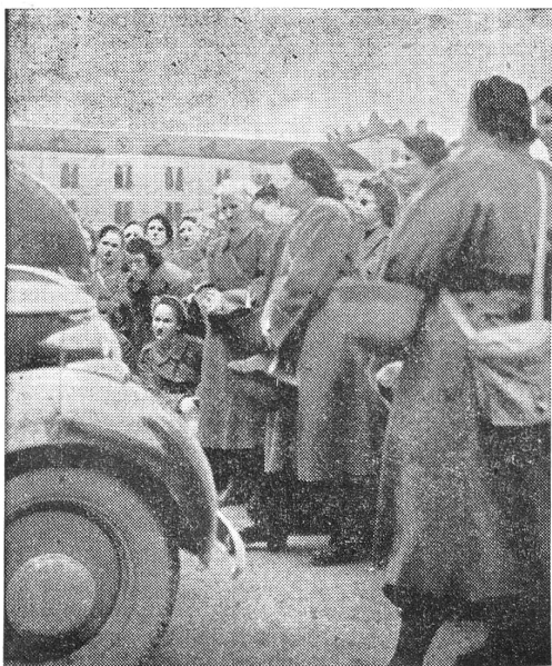
Et voilà le moteur...