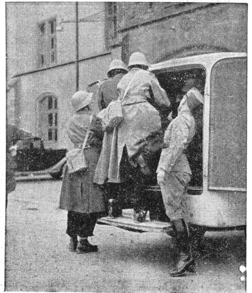
Il faut bien fixer le brancard.