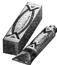
Vindex-Wundsalbe in Tube

„FLAWA“, Schweizer Verbandstoff- u. Wattfabriken AG., Flawil