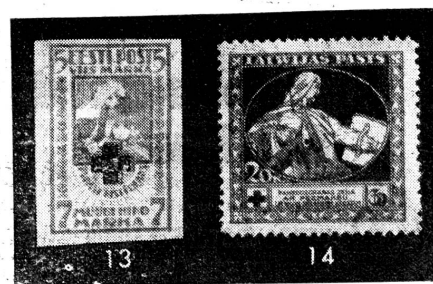
13 = Estland 14 = Lettland

Bis heute war die Schweiz eines der wenigen Länder, das seinem nationalen Roten Kreuze keine Marke bewilligt hatte. Umso erfreulicher ist es nun, dass der 75. Jahrestag der Unterzeichnung der Genfer Konvention Anlass zur Herausgabe der ersten eigentlichen Rotkreuzmarke in der Schweiz sein wird; ist doch kein Land dazu so berechtigt, wie gerade die Schweiz als Ursprungsland des Roten Kreuzes.