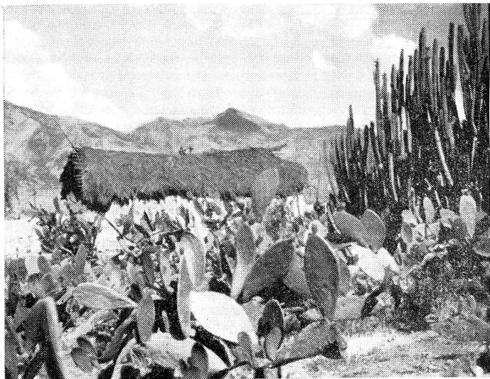
Typische bolivianische Landschaft in der Nähe von La Paz mit indianischem Wohnhaus aus Lehm.

Chachapuma (Löwenmensch) zog mit seinem Heere gegen den wilden Indianerstamm der Tutirihuarias. Interessant ist die Zusam-