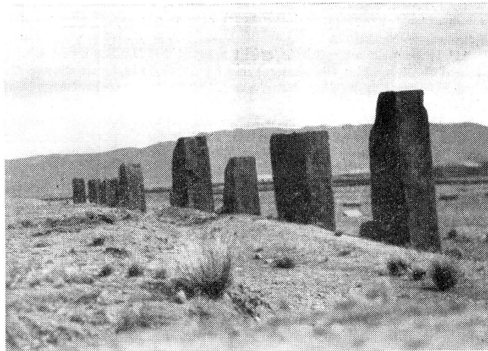
Ruinen des Sonnentempels in Tiahuanacu.

Die Verwundeten waren bereits in drei aus Holz und Rohrgeflecht erstellten Hütten untergebracht worden. Die erste Hütte barg die mit Stichwaffen Verletzten, die zweite die Kämpfer mit Quetschungen und Knochenbrüchen und die dritte war für die inneren Krankheiten reserviert.