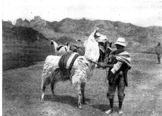
Das Lama, Boliviens Lasttier.

Der Verwundete wurde sorgfältig in den Schatten der ersten Bäume des Waldes getragen, wo ihm ein erhöhtes Lager vorbereitet worden war. Yatiris liessen ihn durch gereizte Töpferwespen (Trypoxylon, Hautflüglergattung der Grabwespen) in Nacken, Rücken, auf Arme und Beine stechen, um ihn durch das Gift des Insektes unempfindlich zu machen. Als der Patient in einen Zustand absoluter Lethargie geraten war, wurde die Haut bei der Fraktur aufgeschnitten und die durchschnittenen Adern mit den feinsten Sehnen des Wiesels oder des Ameisenbären unterbunden. Die Knochensplitter wurden entfernt und die Ränder der Fraktur glatt gemeisselt. Hierauf beugte sich der Künstler unter den Amautas, der Tutumero, über den Patienten und währenddem er die Fraktur genau studierte, formten seine feinnervigen Hände das fehlende Knochenstück aus Wachs. Er verglich noch einmal und alle Aerzte verglichen mit. Erst dann setzte er die Form in die Lücke und glich mit geschickten Fingern die Ränder