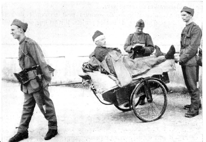
Für Verwundeten transport eingerichteter Fahrradanhänger.