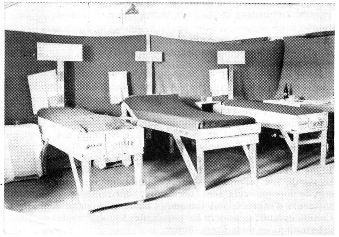
Improvisierte Betten für ein Feldspital. Die Betten sind aus einfachstem Material hergestellt.

einer Alarmübung verbunden war das Abkochen im Einzelkochgeschirr und nachfolgender Zeltbau und Verwendung der Zelleinheit als Wetterschutz. Den Abschluss bildete eine Felddienstübung im Kantonmestraum Sissach, wo eine Uebernahmestelle, verbunden mit Gashilfsstelle eingerichtet wurde. Gleichzeitig erfolgte die Einrichtung von zwei Eisenbahngüterwagen für den Verwundetentransport, und es mussten auch kleine Transportmittel für denselben Zweck improvisiert werden.