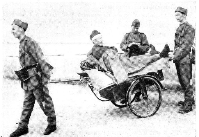
Für Verwundetentransport eingerichteter Fahrradanhänger.