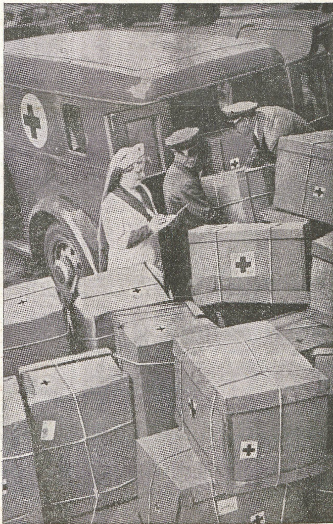
Aerztemäntel und Schwesternschürzen, von Mitgliedern der Rotkreuzsektion Newyork freiwillig angefertigt, werden für die Kriegszonen Europas verschifft