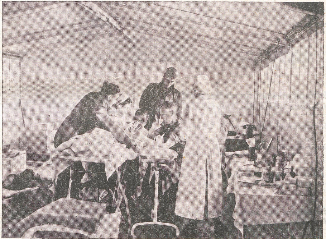
Hôpital de campagne motorisé de la Croix-Rouge allemande — Une salle de pansements

Rotkreuzchefarzt - Médecin en chef de la Croix-Rouge - Medico in capo della Croce-Rossa