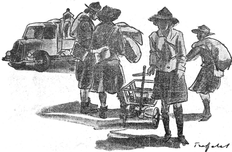
Pfadfinderinnen sammeln Spitalmaterial bei der Bevölkerung Eclaireuses, collectant du matériel d'hôpital