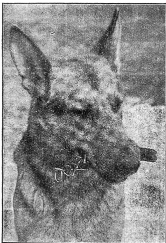
Sobald der Sanitätshund einen Verwundeten gefunden hat, fasst er das am Halsband befestigte Apportel und kehrt zu seinem Führer zurück. (Zensur-Nr. A/Fi/0043.)

Hund einen Verwundeten gefunden hat, das Tier wird an die lange Leine genommen, und es führt nun seinen Führer in raschster Gangart zu dem Hilfsbedürftigen. Sobald die erste Hilfe verabfolgt ist, d. h. der Verwundete richtig gelagert, gelabt und verbunden ist, signalisiert der Hundeführer die Fundstelle seinem Gruppenführer, der nun seinerseits die Meldung mit Kroki an die Sanitätskompanie zurückgibt, die durch ihre Gefechts-Sanitätspatrouillen oder durch Trägertruppen die Abräumung des Gefechtsfeldes besorgt. Der Sanitätshund arbeitet aber indessen ohne Zeitverlust mit seinem Führer weiter; jeder Winkel, jede Hecke und jeder Busch wird rastlos und unermüdet abgesehen und ein Gefechtsfeld, das von Sanitätshunden durchstöbert wurde, darf ohne weiteres als vollständig abgeräumt betrachtet werden. Es ist geradezu rührend, zu beobachten, wie die Tiere oft unter Einsatz der letzten Kräfte mit dem Apportel im Maul zu ihrem Führer zurückrasen,