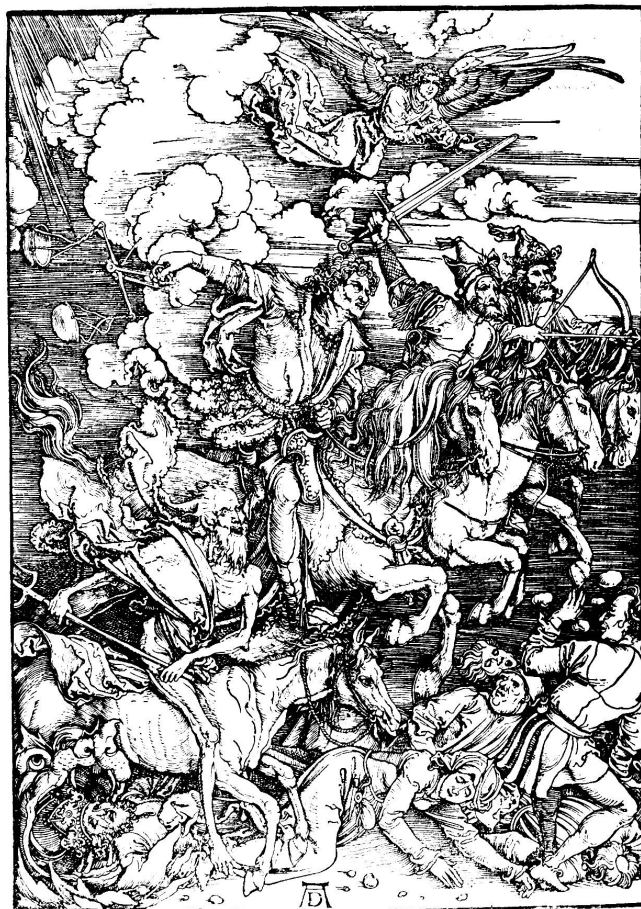
Albrecht Dürer: Die apokalyptischen Reiter. Holzschnitt.

Am 10. Oktober 1921 eröffnete das Schweiz. Rote Kreuz eine Sammlung zur Ausrüstung einer Spitalexpedition nach Russland. Mitgefühl und Erbarmen siegten über die tiefe Abneigung gegen die Ideologie der Sowjetunion, so dass die Sammlung allein in der Schweiz binnen