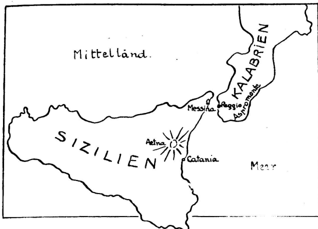
Karte des Erdbebengebietes