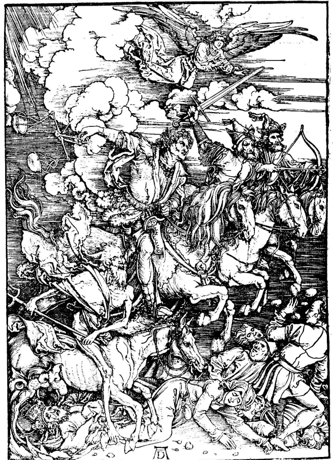
Albrecht Dürer: Die apokalyptischen Reiter. Holzschnitt.

Am 10. Oktober 1921 eröffnete das Schweiz. Rote Kreuz eine Sammlung zur Ausrüstung einer Spitalexpedition nach Russland. Mitgefühl und Erbarmen siegten über die tiefe Abneigung gegen die Ideologie der Sowjetunion, so dass die Sammlung allein in der Schweiz binnen