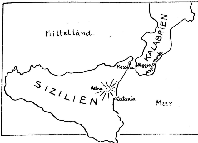
Karte des Erdbebengebietes