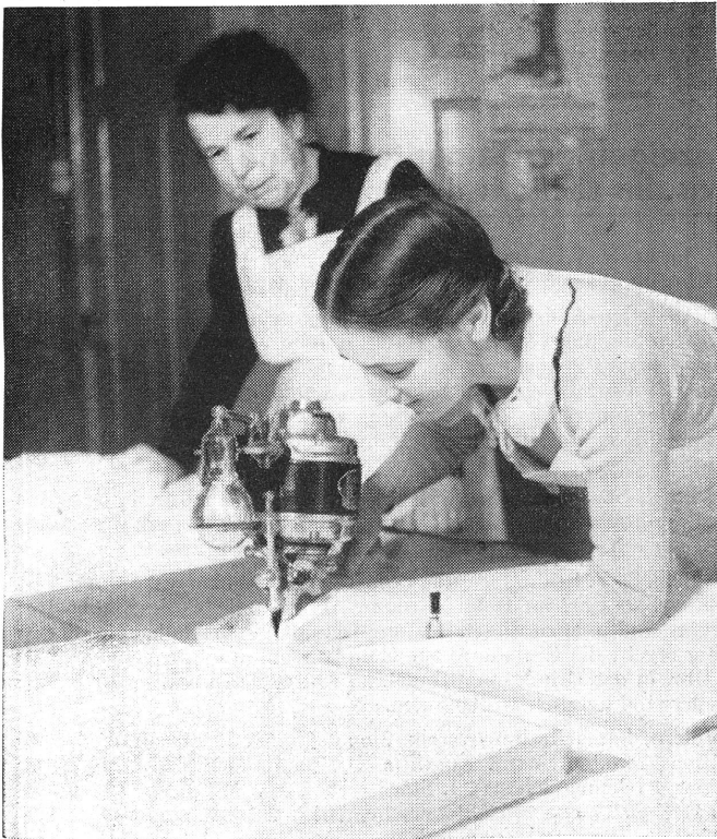
Ein Schneideratelier hat dem Zweigverein vom Roten Kreuz, Olten, eine Zugschneidemaschine zur Verfügung gestellt. Dank dieser Maschine und der grossen Schicklichkeit der Frauen vom Zweigverein ist es möglich, bis zu 105 Wäschestücke auf einmal zu schneiden.