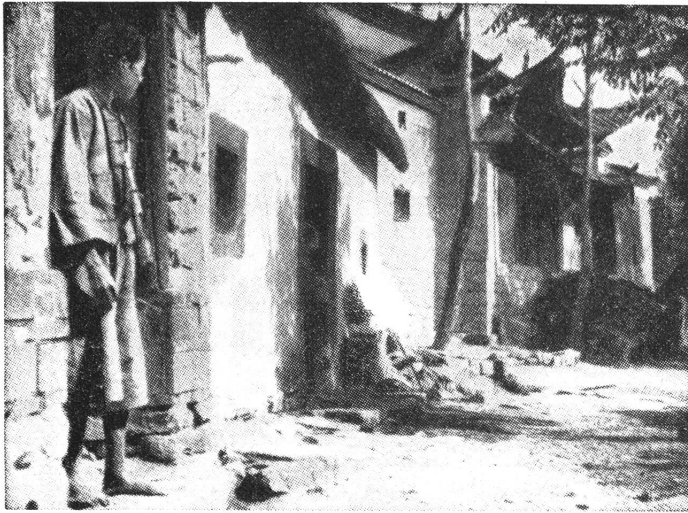
Sonniges Gässchen bei Ileang Ruelle ensoleillée près d'Ileang

10 cent. — la medesima usata finora nella colletta settimanale, ma in altra tinta — in favore dei bambini vittime della guerra. Si capisce che non si tratta affatto d'un obbligo e ognuno è libero di rifiutare l'acquisto.