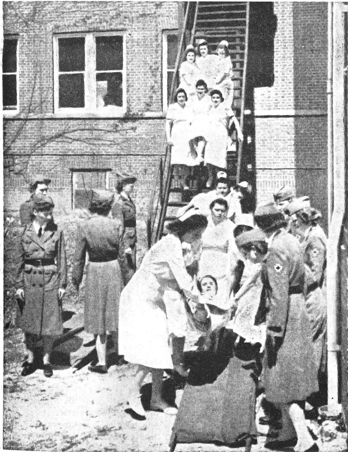
Englische Krankenschwestern und Rotkreuzfahrerinnen üben die Evakuierung des Norfolk Hospitals für den Fall eines Bomben- angriffs.

Die Rekrutierung des Personals der Fürsorgestellen beruht in erster Linie auf dem Grundsatz der Freiwilligkeit . Es ist zu hoffen, dass damit gute Erfahrungen gemacht werden. Vielfach ist ja die freiwillig geleistete Arbeit besonders wertvoll. Nur soweit die freiwilligen Hilfskräfte nicht ausreichen, können bestimmte Personenkategorien zum Fürsorgedienst aufgeboten werden. Der Bundesrats-