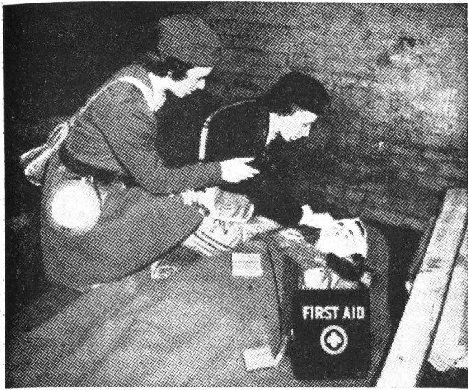
Auch das Amerikanische Rote Kreuz bereitet sich für Bombenangriffe vor.

La Croix-Rouge Américaine aussi fait des préparations en vue d'attaques par des bombardiers.