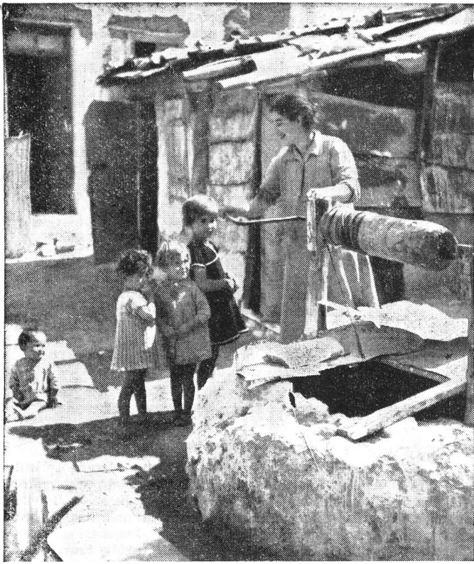
Mission des Schweizerischen Roten Kreuzes, Kinderhilfe in Griechenland. Hof des alten Milchzentrums Pangrati in Athen.