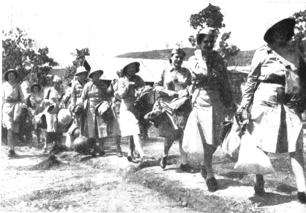
Amerikanische FHD in Neu-Guinea.