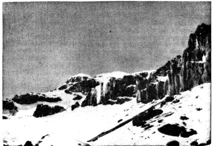
Aufstieg auf den Sajama

Sektion Zürich. 6. 3. 44, Höck, FHD-Haus, 2000. — 14. 3. 44, Amthaus V, 1930: Administrative Uebung. Leitung: Lt. Jaquemet. — 28. 3. 44, Weisser Wind, 2000, Jahresversammlung der Sektion. Leitung: Der Arbeitsausschuss. — FHD-Turnen: Freitags 1900—2000, Sihlhölzli-Turnhalle.