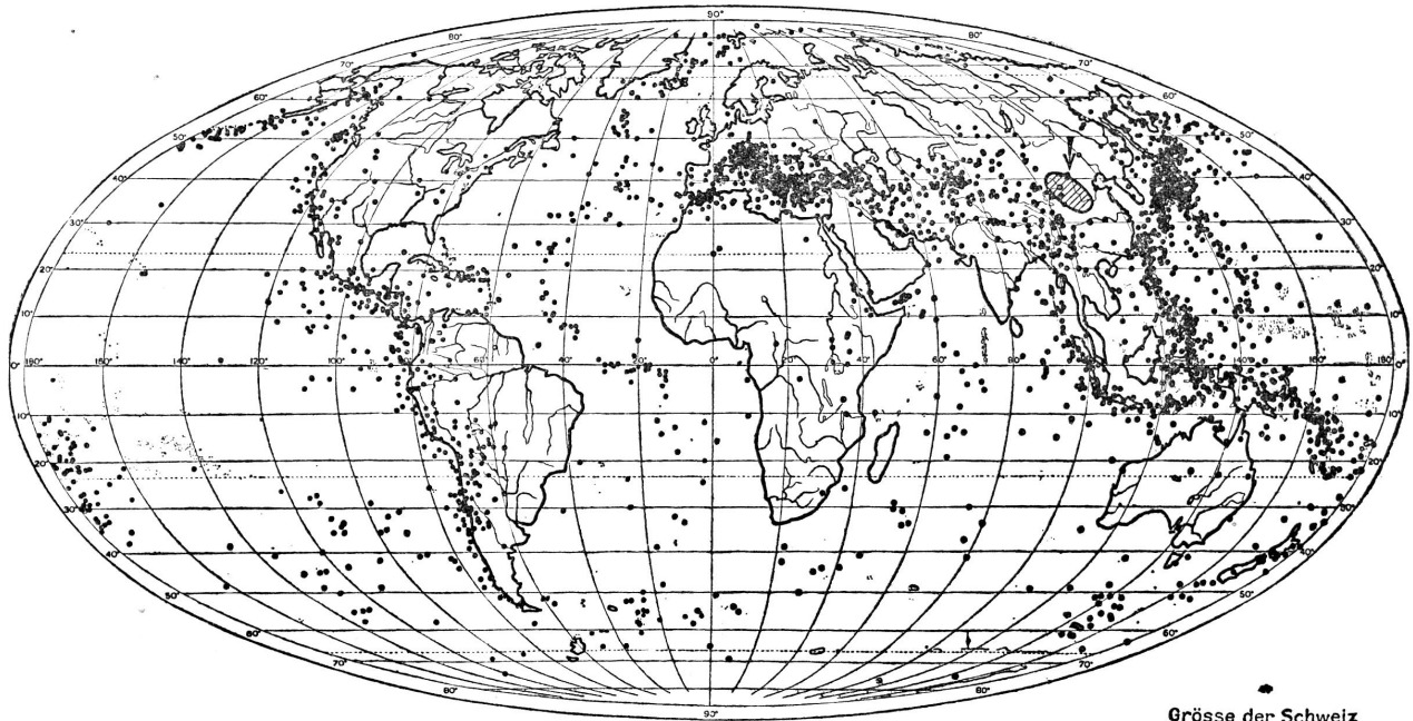
Durch die Erdbebenwarten bestimmte Erdbebenherde der letzten 30 Jahre. Foyers de tremblements de terre enregistrés par les séismographes pendant les 30 dernières années.

vaient voir ces enfants victimes de la guerre, ils n'hésiteraient pas un seul instant: faisant confiance au Secours aux enfants de la Croix-Rouge suisse, ils souscriraient aussitôt au «Sou hebdomadaire» et achèteraient le «Bol de lait» les 4 et 5 mars prochain, reconnaissants à la Providence de ne pas connaître la guerre, de manger à leur faim, de dormir paisiblement et d'en être quittes à si bon compte, alors que des millions de leurs semblables et d'enfants comme les nôtres n'ont plus d'espoir que dans ce que nous pouvons faire pour eux. P. R.