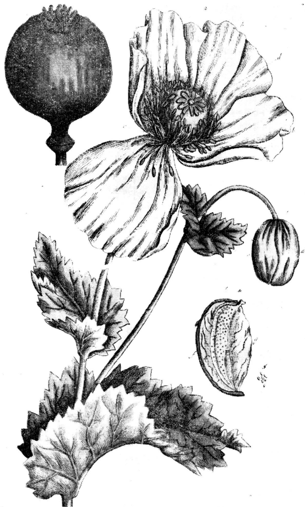
Papaver somniferum album

Weisser Schlafmohn. Natürliche Grösse. - Pavot blanc. Dimension naturelle.