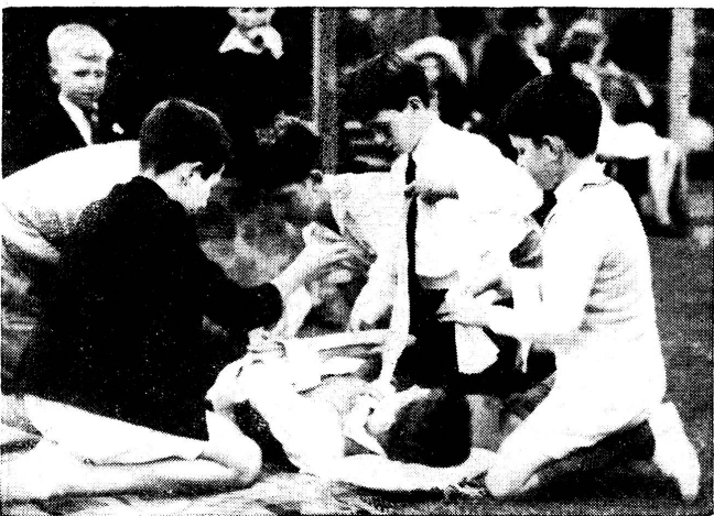
Australien: Unterricht in erster Hilfe Australie: Enseignements de premiers secours