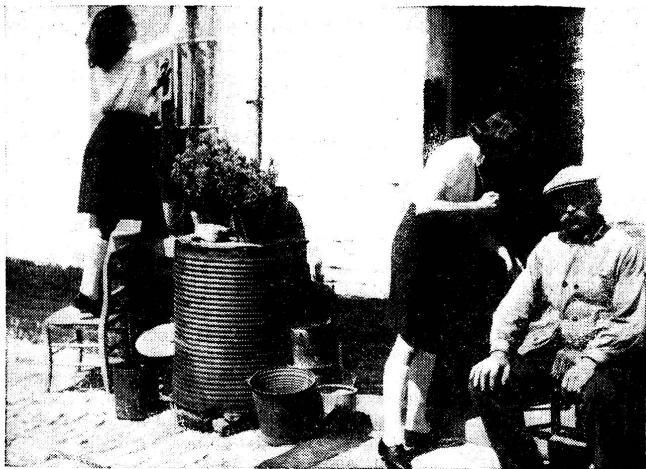
Belgien: Rotkreuz-Jugend hilft im Haushalt Belgique: Des cadettes de la Croix-Rouge aident les vieux ménages défavorisés

Die Tätigkeit des Jugendrotkreuzes hat sich gemäss den Richtlinien der Vereinbarung von 1922 entwickelt. Die Junioren führen, je nach Möglichkeit, das Programm des Roten Kreuzes durch, wobei jedes Land das Programm den speziellen Bedürfnissen und Umständen seines Landes anpasst.