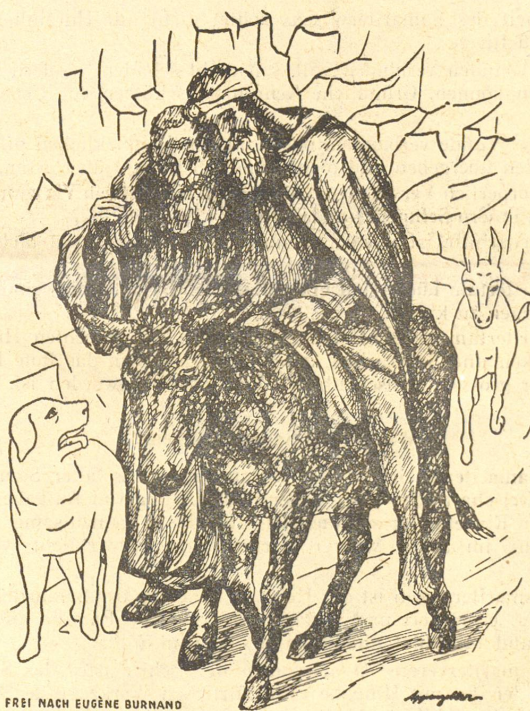
FREI NACH EUGÈNE BURNAND

Action de propagande de l'Alliance suisse des Samaritains