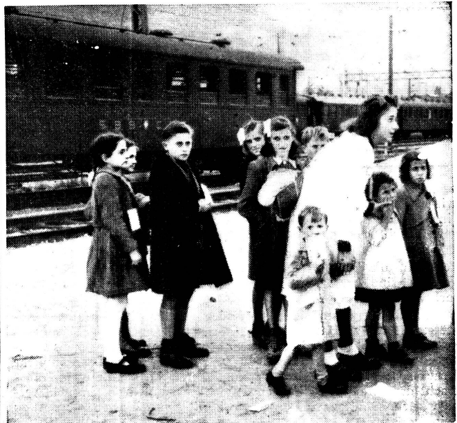
Im Oktober 1944 sind zahlreiche Kinder aus dem gefährdeten Ossolatal in Brig eingetroffen. Bei ihrer Betreuung haben Samariterinnen mitgeholfen, sorgten im Auftrag des Schweiz. Roten Kreuzes, Kinderhilfe, für die Verpflegung und übernahmen auch die Begleitung beim Transport ins Innere unseres Landes.

Die unsererseits zur Prüfung dieser Anregung gemachten Feststellungen haben ergeben, dass wenn wir alle für unsere Sektionen