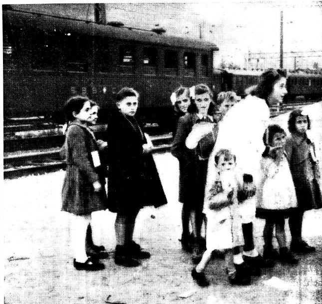
Im Oktober 1944 sind zahlreiche Kinder aus dem gefährdeten Ossolatal in Brig eingetroffen. Bei ihrer Betreuung haben Samariterinnen mitgeholfen, sorgten im Auftrag des Schweiz. Roten Kreuzes, Kinderhilfe, für die Verpflegung und übernahmen auch die Begleitung beim Transport ins Innere unseres Landes.

Die unsererseits zur Prüfung dieser Anregung gemachten Feststellungen haben ergeben, dass wenn wir alle für unsere Sektionen