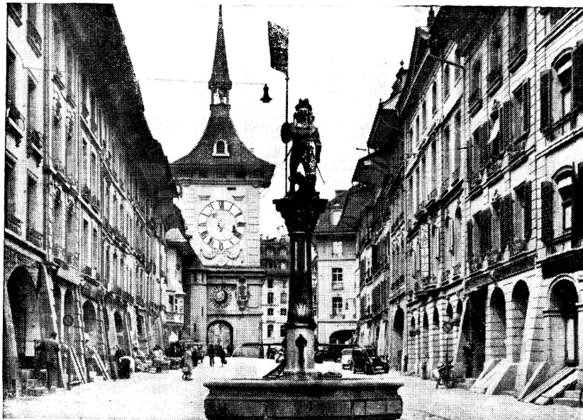
Zeitlockenturm — Tour de l'Horloge.