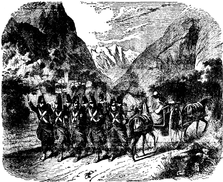
Mobilisation 1859. Schweizerische Grenzbesetzungstruppen vom St. Bernhardin herabsteigend