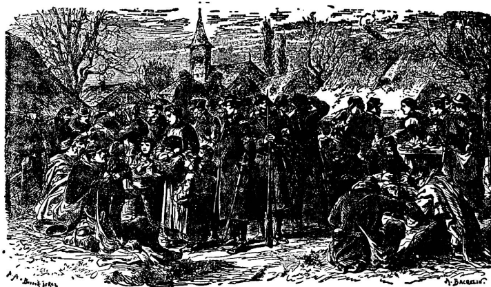
Bourbaki-Internierte in einem bernischen Dorfe, 1871

sah sich der Bundesrat erneut genötigt, einen General zu wählen und Truppen aufzubieten, und er hatte gut daran