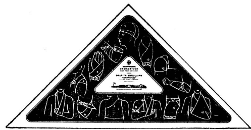
FABRIQUE INT. D'OBJETS DE PANSEMENT SCHAFFHOUSE, NEUHAUSEN

Triangle de Schaffhouse selon le professeur Esmerch. Les 14 principales applications sont imprimées sur le triangle. Base: 118 cm. Prix pour les sociétés de samaritains: fr. 1.90 + 25% de supplément de renchérissement.