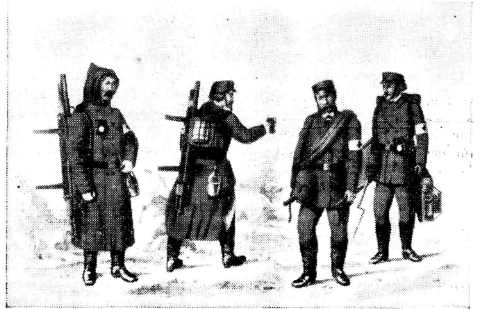
Mitglieder des Krankenträgerkorps des Karlsruher Männerhilfsvereins. Sie tragen Armbinden mit dem Abzeichen des Roten Kreuzes. Litographie aus dem Jahre 1870.

Auf deutscher Seite war die Organisation der freiwilligen Hilfe von Anfang an weiter fortgeschritten als bei den Franzosen. Man verfügte hier vor allem über grössere Geldmittel, beliefen sich doch die Beiträge und Spenden auf 70 Millionen Mark. Trotzdem gestalteten sich der militärische Sanitätsdienst und das freiwillige Hilfswerk auch hier noch nicht reibungslos. 1870 wies ein Arzt in der Leipziger «Illustrierten Zeitung» auf den Mangel an Sanitätspersonal in den Laza-