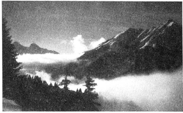
Ruhig liegender Talnebel, in Auflösung begriffen. Es wird ein sehr schöner Tag werden.

Was kann nun der Tourist im winterlichen Hochgebirge tun, um all diesen Gefahren zu entgehen? Die Schweiz besitzt einen gut ausgebauten Wetter- und Lawinendienst, deren Berichte über unsere Landessender ausgestrahlt werden. Der Skifahrer, der eine grössere Tour unternehmen will, höre sich diese Berichte vor dem Aufbruch genau an. Nötigenfalls wird er sich mit den Prognostikern der beiden Institute noch persönlich in Verbindung setzen, um nähere Auskunft für das von ihm gewählte Tourengebiet zu erhalten. Erst nach diesen Konsultationen treffe er seine Dispositionen. Es ist falsch, solche Auskünfte nicht einzuholen, weil sich die Prognostiker auch einmal irren können. Die Erfahrungen im Aktivdienst und auch nachher haben den grossen Wert dieser Prognosen unter Beweis gestellt, und das zu einer Zeit, in der aus dem Ausland so gut wie gar keine meteorologischen Meldungen einliefen.