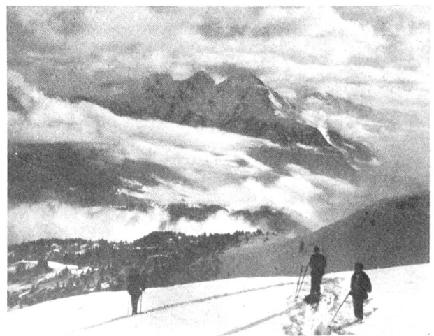
Oben: Mittlere Schichtwolke. Unten: Niedere Schichtwolken. Es kann alles daraus werden!

meterbreite Pisten. Seine Skispuren sind die ersten im jungfräulichen Schnee, und die Abfahrt muss durch stundenlangen, oft mühsamen Aufstieg verdient werden. Solche Touren lassen sich auch nicht mit dem Chronometer in der Hand zwischen zwei Schnellzügen erledigen. Meistens sind für sie das Wochenende oder gar mehrere Tage in Aussicht genommen. Da heisst es dann umsichtig planen, nicht nur, was die Ausrüstung betrifft, sondern auch hinsichtlich des mutmasslichen Wetterablaufs. Oft müssen gerade schon am Anfang schwerwiegende Entscheidungen fallen. Ist das