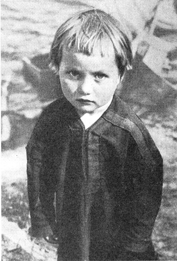
Ein Lappenkind.

haft. Auf seinem schönen, aber kargen Boden hat der Finne durch Ueberlegung und Tatkraft eine kraftvolle Kultur geschaffen. Hat der Reisende die Einsamkeit der Forsten erlebt und den kalten Hauch der Sümpfe verspürt, dann muss er auch alles das sehen, was generationenlange Menschenarbeit geschaffen hat: die fruchtbaren Felder und die Städte, wo eingeborene Schlichtheit der Seele sich mit hoher westlicher Kultur vermählt. Turku mit seinem mittelalterlichen Schloss und Dom ist reich an geschichtlichen Erinnerungen. Oulu an den schäumenden Merikoski-Stromschnellen ist die Hauptstadt von Nordostbothnien. Porvoo, eine malerische kleine Stadt mit winkligen Strassen, ist als Heimatstadt J. L. Runebergs, des berühmtesten Dichters Finnlands, bekannt; Tampere wäre als Industriezentrum zu nennen, Savonlinna als Perle des Saima-Seensystems, Rauma als alte Schifferstadt; und schliesslich Helsinki, die lebensvolle Hauptstadt auf ihrem Untergrund von Granitfelsen — in all diesen Städten kann der Fremde seinen Eindrücken vom finnischen Leben neue Züge hinzufügen. In jeder wird er — wie auch im entlegensten Dorfe — einen Vorposten der Zivilisation finden, einen intellektuellen Brennpunkt, der weit über die Schneefelder des Nordens hin seine Strahlen ausendet.