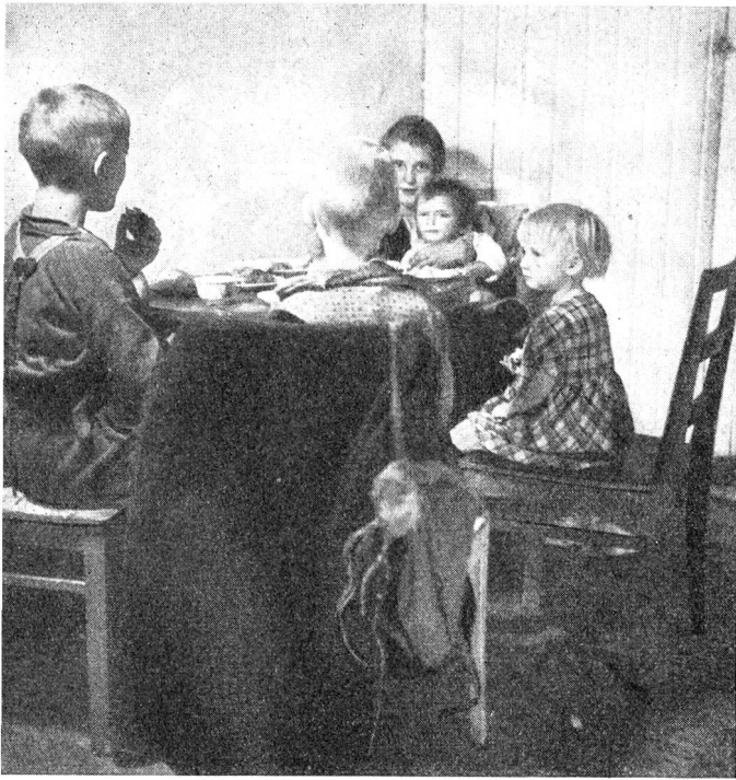
Finnische Mutter mit ihren Kindern.

Aufrecht und symmetrisch, eine Pyramide aus dunkelgrünen Aesten, ist auch die Fichte in ihrem nachdenklichen Ernst wohl einer der schönsten Bäume Finnlands. Die Finnen scheinen seit Vorväterzeiten ihre Behausungen mit Vorliebe in ihren Schatten gebaut zu haben. Ein alter Spruch rät: «Lausche dem Raunen der Fichte, in deren Schutz du dein Haus gebaut.»