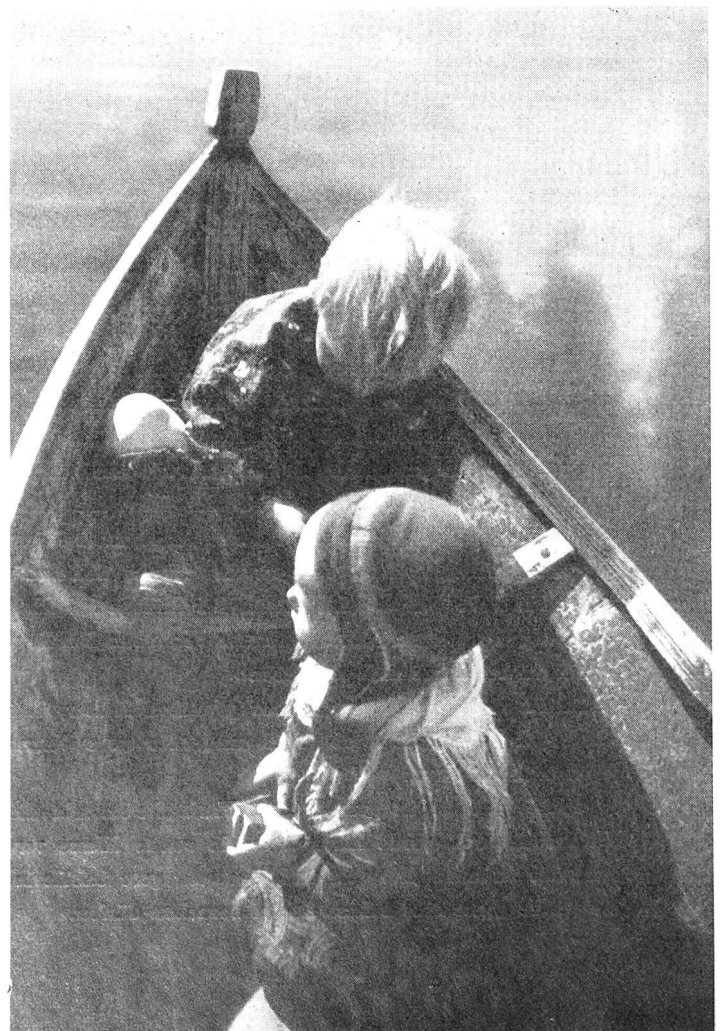
Früh übt sich, wer ein Meister werden will. Lappländische Kinder spielen im väterlichen Boot.

Wer jedoch nur die äusseren Züge Finnlands kennt, dessen Wissen um das Land ist nur mangel-