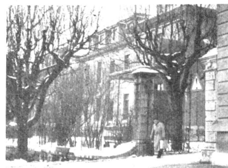
Auch nach der Operation wird unserem Patienten täglich Blut transfundiert. Nach verhältnismässig kurzer Zeit verlässt er, wieder gänzlich hergestellt, das Spital.