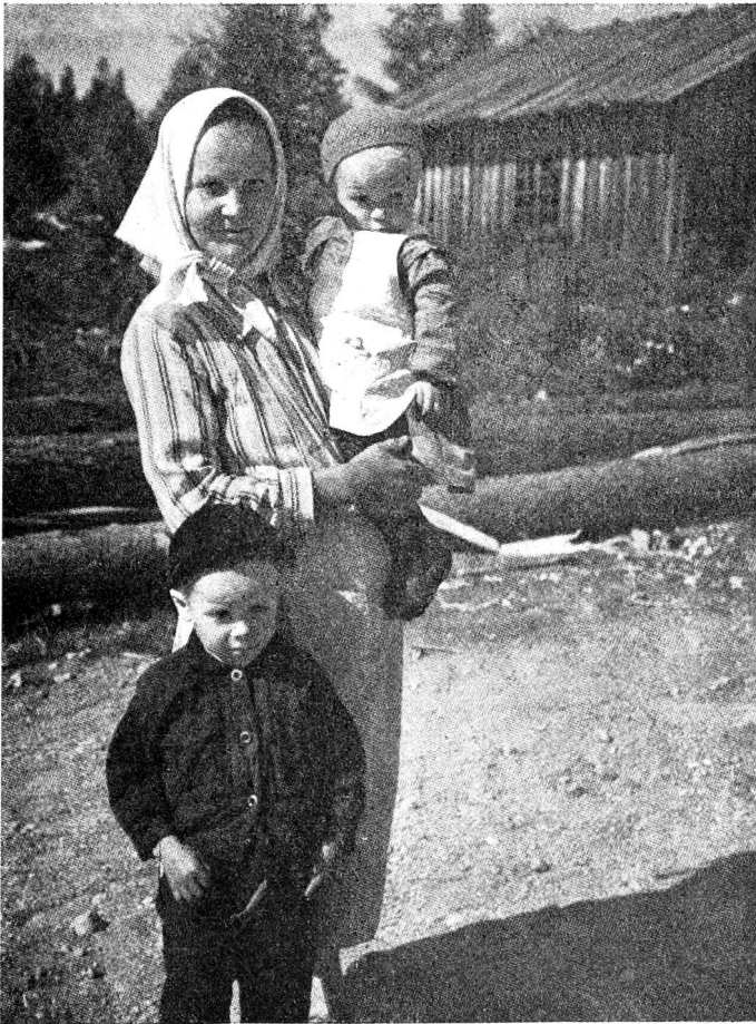
Oberes Bild: Finnische Mutter.