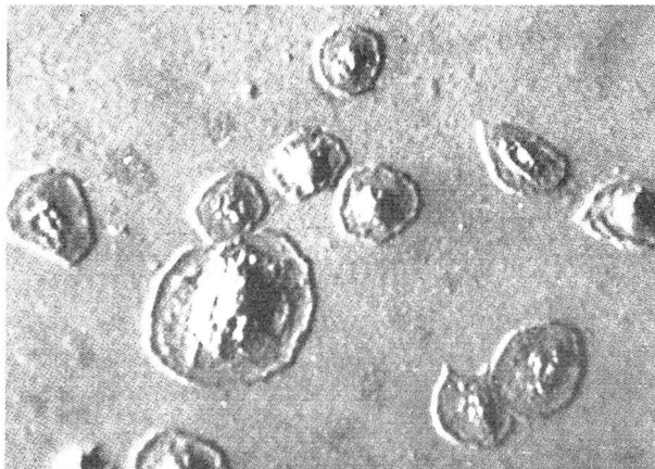
Ungefärbte, einzeln liegende Blutplättchen in einer Phasenkontrast-Aufnahme.

Der Vorgang der Blutgerinnung wird durch Verklebung und Zerfall der Blutplättchen eingeleitet. Innerhalb der Blutbahn tritt normalerweise keine Gerinnung ein, da die Plättchen an den äusserst glatten Gefässwänden nicht haften können und vom Blutstrom dauernd durchmischert werden. Bei Verlangsamung des Blutkreislaufes infolge Blutstauung, bei Erkrankungen der Gefässe mit Aufrauung der