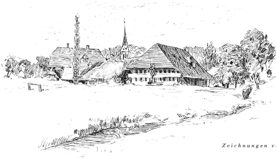
Zeichnungen von H. Bachmann