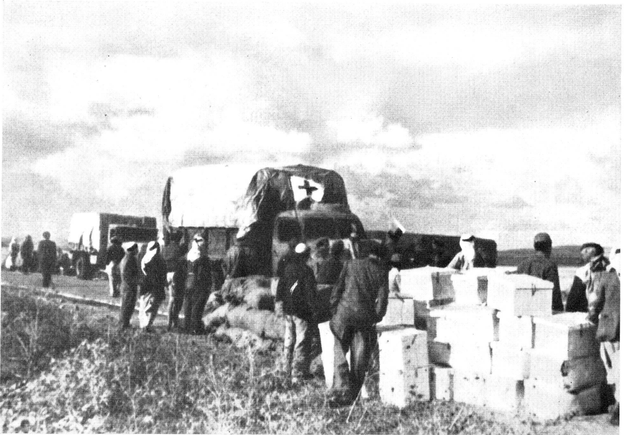
Ankunft eines Lebensmitteltransportes in einem Flüchtlingslager.

bringen, Ortspersonal ausbilden; einfache, doch sichere Massnahmen für Empfang, Aufbewahrung und Verteilung von Tausenden von Tonnen Waren und Medikamenten treffen; den Warenverderb, die Diebstähle, die Missbräuche aller Art, die inmitten einer demoralisierten und ausgehungerten Bevölkerung unvermeidlich sind, zu hindern suchen. Die