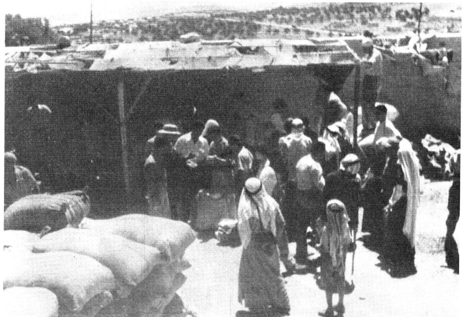
Verteilung von Lebensmitteln an Flüchtlinge in einem Lager von Jordan-Palästina.

Arbeit wuchs mit jedem Tag. Es genügt, daran zu erinnern, dass die Zahl der Schweizer, die im Jahre 1949 zwanzig, später dreissig betrug, heute zu fast hundert angewachsen ist; sie werden zudem durch ein Ortspersonal von ungefähr 2000 bezahlten Kräften — Aerzten, Assistenten, Angestellten und Arbeitern aller Kategorien — unterstützt.