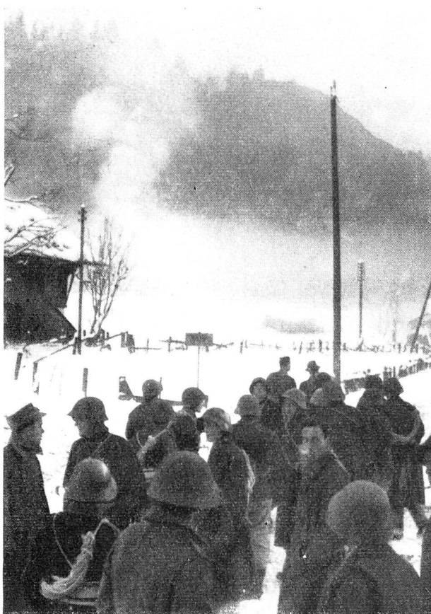
Schweres Explosions-Unglück im Munitionsdepot bei Blausee-Mitholz.